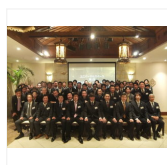
介護リフォーム本舗メンバー