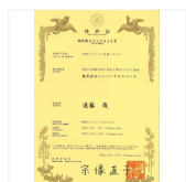
ビジネスモデル特許 特許証