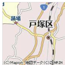
神奈川県横浜市戸塚区戸塚町...