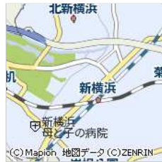
神奈川県横浜市港北区新横浜...