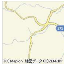
グループホーム鶴の里