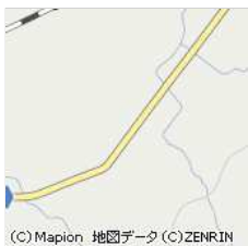
チャレンジビッグ大沼黒ベコ