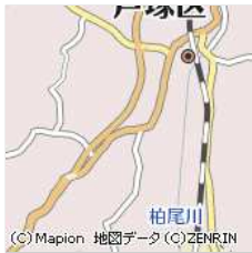
神奈川県横浜市戸塚区戸塚町...