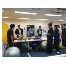
キックオフミーティング 1