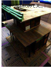
手すりの天守閣組立