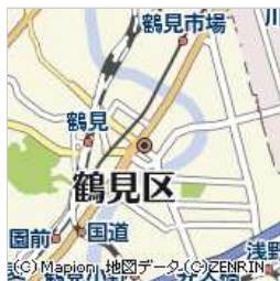
神奈川県横浜市鶴見区