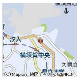
神奈川県横浜賀市