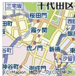
経済産業省別館 食堂