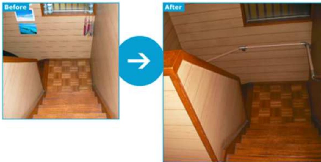
介護リフォーム・ビフォーアフター

『介護リフォーム本舗』は、「手間がかかる」「単価が安い」と建設業者らに後回しにされがちな介護リフォームを、業界では初めて効率化・システム化することに成功し、2013年にフランチャイズ化を開始。単価が低くても収益 このリリースを見た人が興味がある につなげられるビジネスモデルを構築し、2016年には、経済産業省の「先進的なリフォーム事業者表彰」にも選出されました。