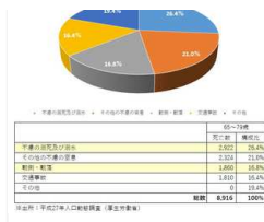
交通事故よりも転落が原因