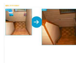
介護リフォーム・ビフォーアフター