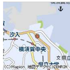
神奈川県横須賀市