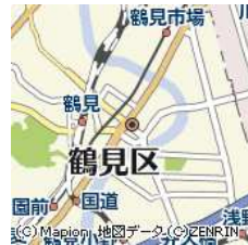
神奈川県横浜市鶴見区