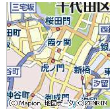
サブウェイ 経済産業省本省...