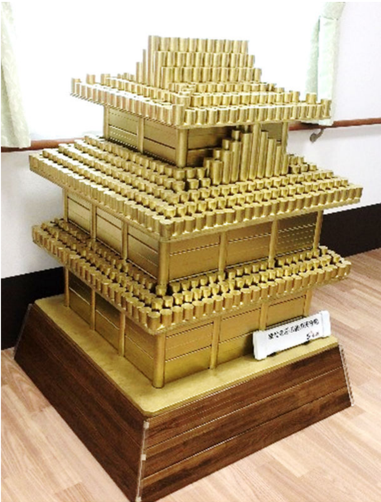
昨年、制作した黄金の天守閣

本プロジェクトは、介護の現場で自立支援に欠かせない手すりの端材のみを使って“黄金の天守閣”を制作するもので2018年にスタートしました。第2回の開催となる今回は、法人加盟のフランチャイズ店4店舗が参加し、3つの模型を制作。完成品は、9月16日の敬老の日に地域の高齢者デイサービス事業所3施設に寄贈します。