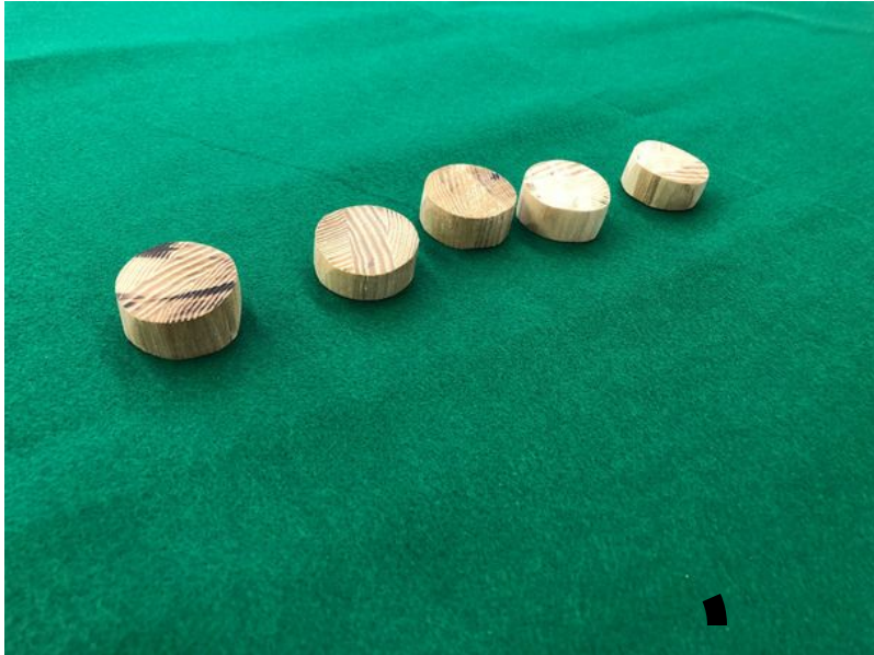
つかみやすい厚みのある形状