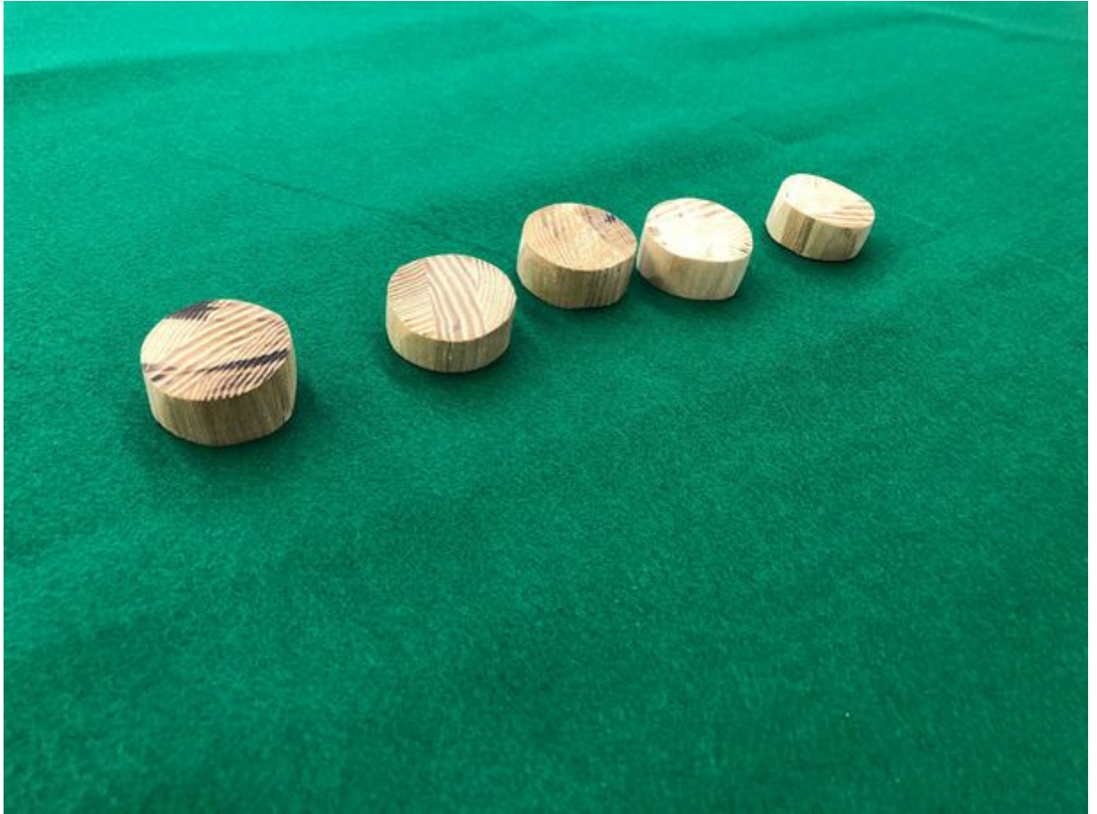
つかみやすい厚みのある形状