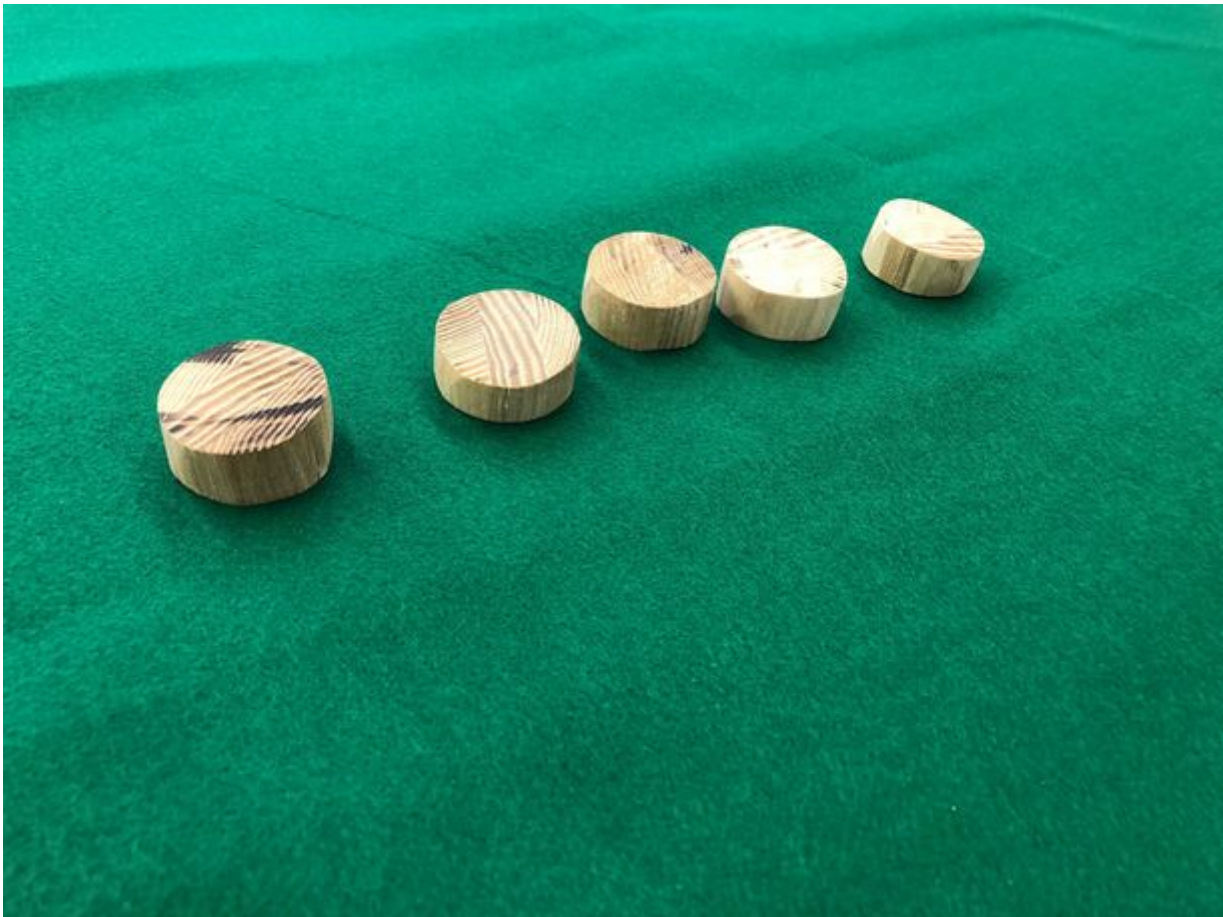
つかみやすい厚みのある形状