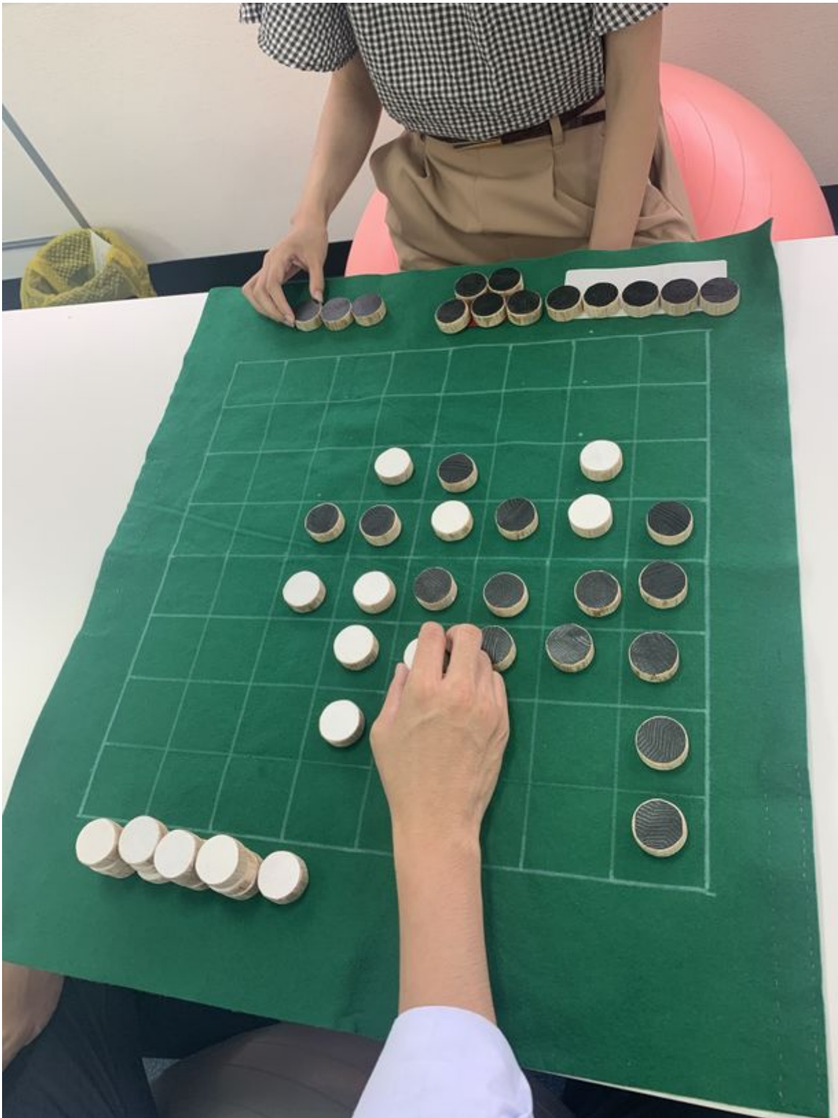
手すりの端材で作ったリバーシ