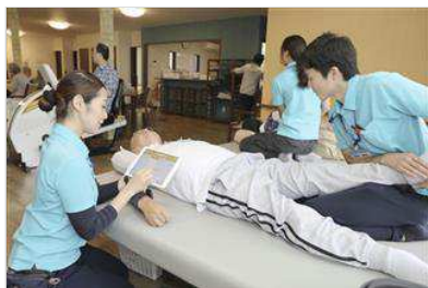
機能訓練をする利用者のそばでタブレット端末を使う施設の職員(左)＝さいたま市の「あしすとリハ与野」【拡大】